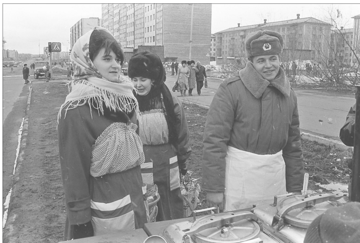
ПРАЗДНОВАНИЕ 50-ЛЕТИЯ ВЕЛИКОЙ ПОБЕДЫ В ВОРКУТЕ. ФОТО Д. ЮЛЬЕВА. «ЗАПОЛЯРЬЕ», 13 МАЯ 1995 Г.

А в Воркуте уже который год идет непрекращающаяся война – за права северян, за настоящее и будущее города.